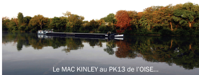
Le MAC KINLEY au PK13 de l'OISE...