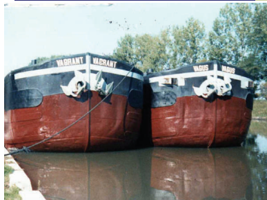
Vagus-Vagrant à Saint-Satur (Cher) en 1986